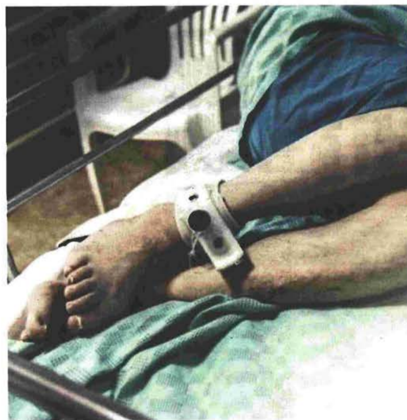
Στο εισαγγελικό πόρισμα θα αναφέρεται και ένα προγενέστερο περιστατικό θανάτου ασθενούς που φέρεται ότι πέθανε από θρόμβωση, ενώ ήταν δεμένος.

του 7ου, από το βιβλίο καταγραφής οχημάτων της κεντρικής εισόδου του φύλακα. Ούτε η μητέρα μου με επισκέφτηκε (η μοναδική ημέρα που δεν με επισκέφτηκαν οι γονείς μου, οι οποίοι με είχαν ενημερώσει σχετικά από την προηγούμενη), ούτε δεμένος ήμουνα, ούτε βγήκα έξω και ούτε φυσικά βρήκα αναπήρα για να βάλω φωτιά στον χώρο μου, ήμουν ήρεμος, παρακολουθούσα τηλεόραση και ως τις 15.20 περίπου συζητούσα με τον νοσηλευτή. Σκόπιμα κατασκεύασε το ανωτέρω σενάριο, προκειμένου να κατηγορήσει εμέ-